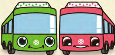
ぐるっと00 すばっと住屋